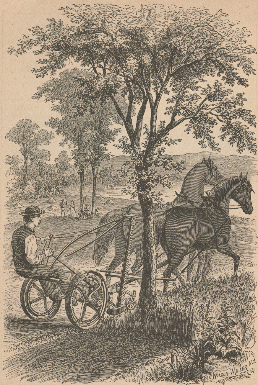
N:o 1. Tvåhjulig Slättermaskin, mötande ett hinder. Skärvidd 4 fot 6 tum.