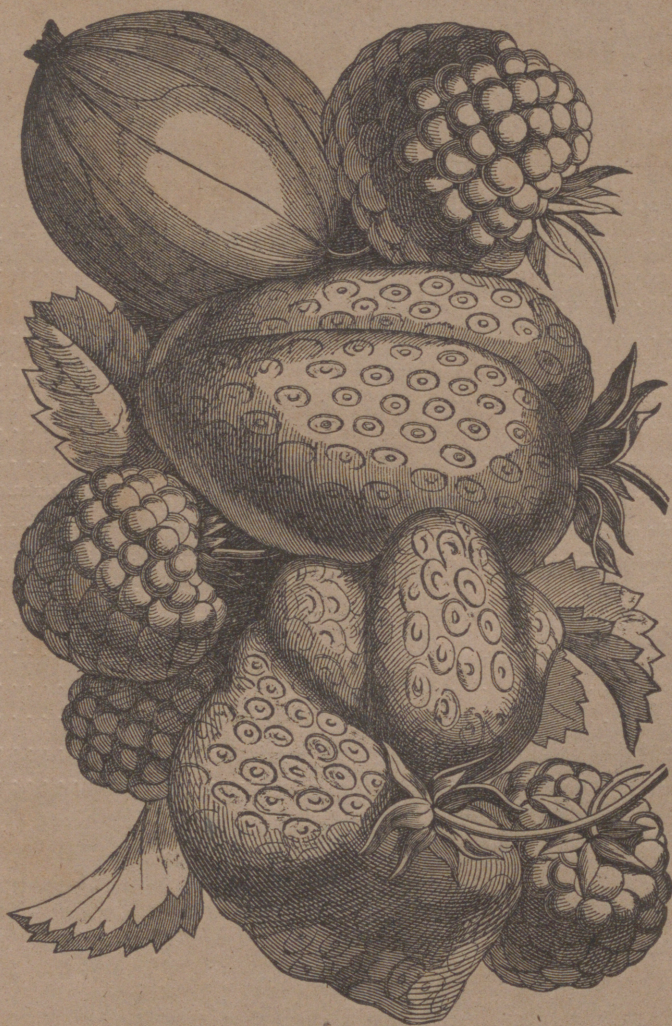
Nyaste sorter af Jordgubbar, Hallon och Krusbär. Se pag. 2.