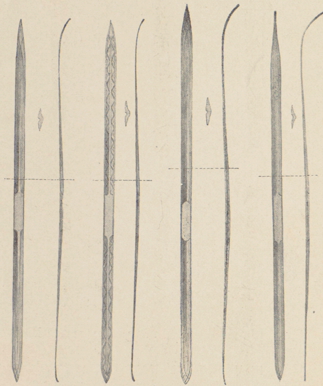
Fig. 1. Fig. 2. Fig. 3. Fig. 4.