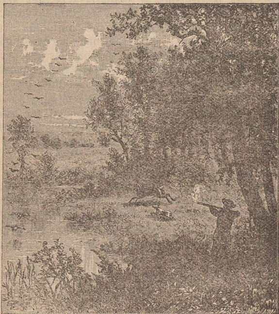
Under jagt och fiske.

Som fisk och villebråd ymnigt förekomma i Manitoba och Nordvestern, är det svårt att säga, hvilka platser som i detta afseende särskildt böra framhållas. Skogssjön, Winnipegsjön, Manitobasjön, Deceptionsjön, Shoalsjön, och de otaliga floder, som tillflyta dem, Röda Floden, Assiniboine, Saskatchewan, Scratching,