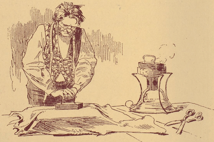
för handverkare, såsom Skräddare och Bleckslagare.