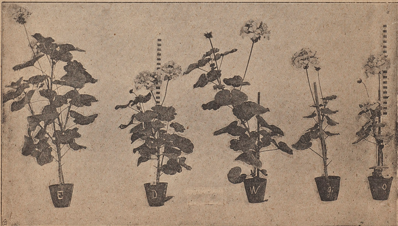
Kulturförsök vid Aas Landbruksakademi sommaren 1893.

Nedanstående illustration visar en grupp Pelargonier som vid detta tillfälle fotograferades efter att haiva varit underkastade nämnda experiment.