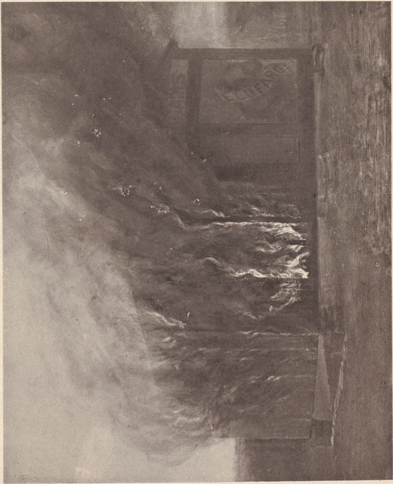
30 minuter efter antändningen.