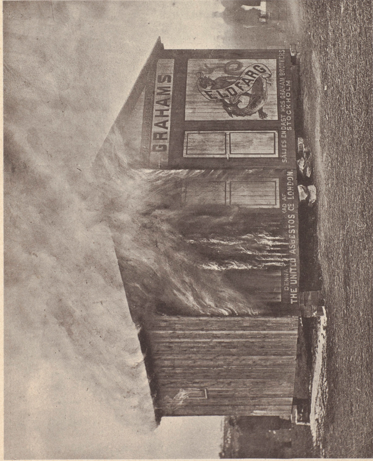
15 minuter efter antändningen.