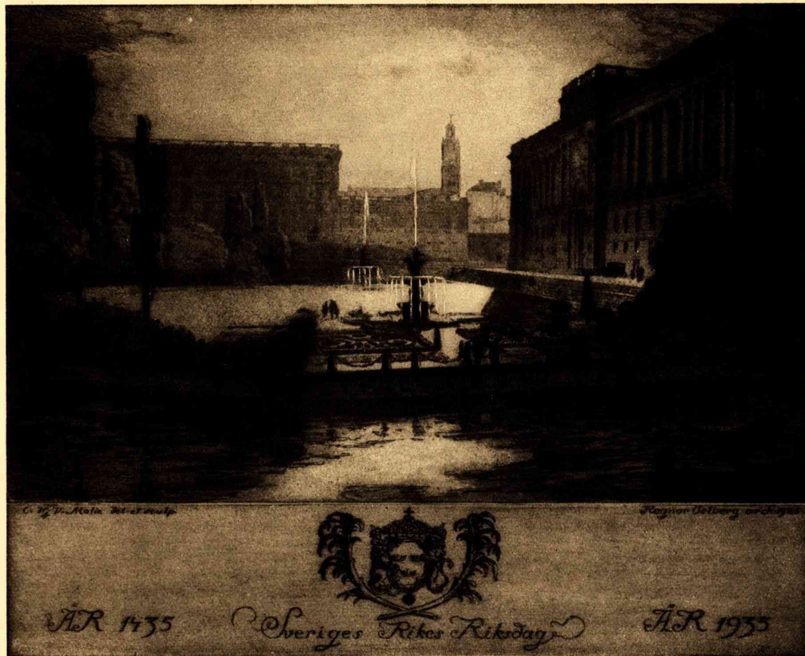
RIKSDAGSHUSET MED PLANEN FRAMFÖR