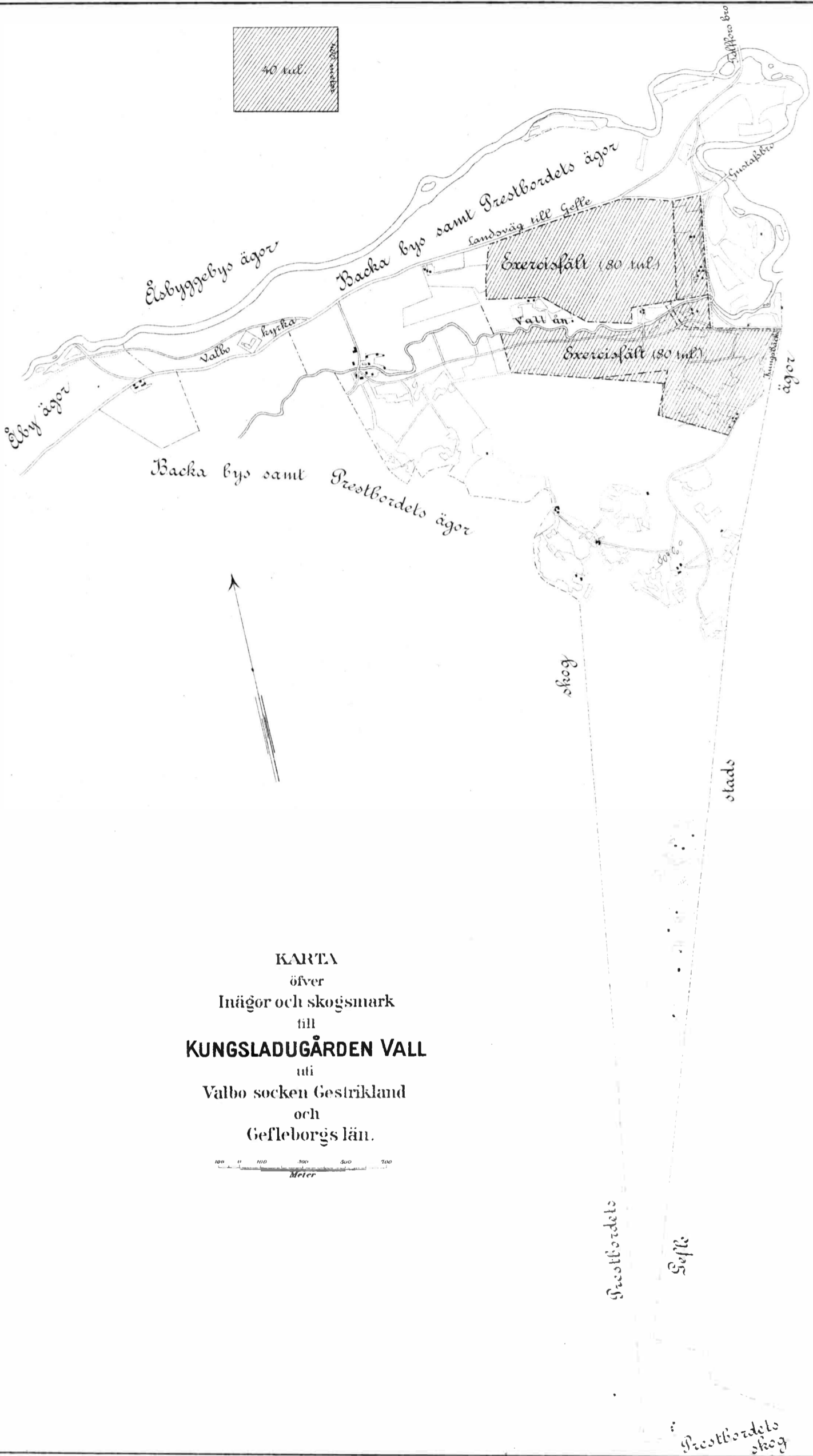
KARTA öfver Inägor och skogsmark till KUNGLADUGÅRDEN VALL uti Valbo socken Gestrkland och Gefleborgs län.