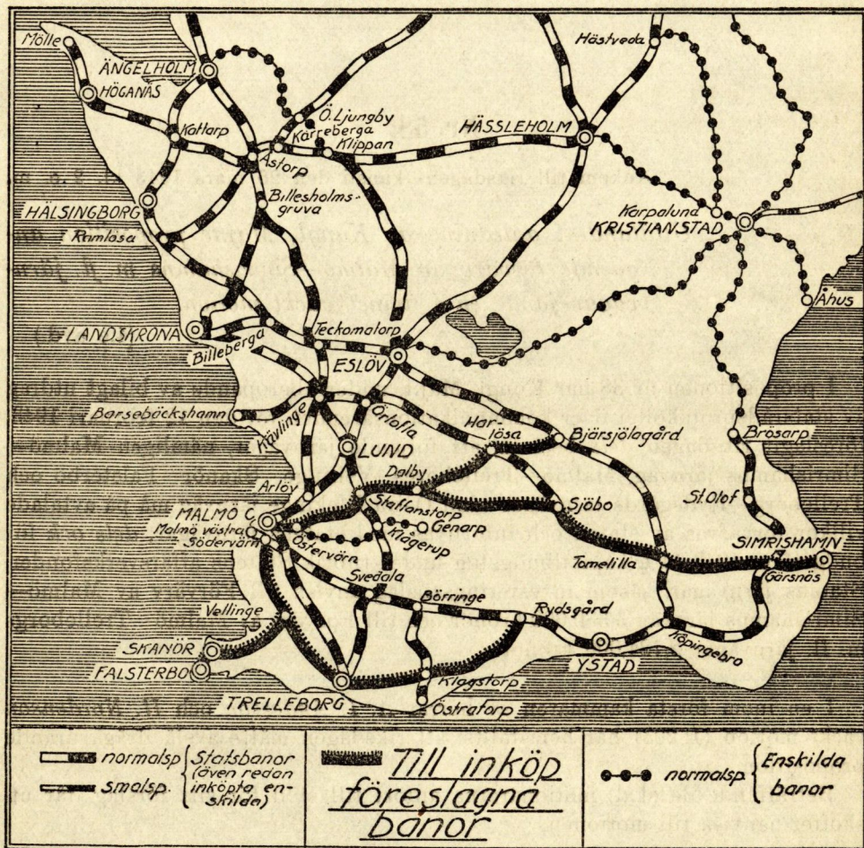
Malmö—Simrishamns m. fl. järnvägar.

1:o) Malmö—Simrishamns järnväg. Malmö—Simrishamns järnväg omfattar en sammanlagd banlängd av 118.9 kilometer. På grund av att järnvägen med sin sträckning tvärs över Skåne på åtskilliga ställen skär statens järnvägars nuvarande linjer medför ett införlivande av järnvägen i statsbanenätet fördelar ur järnvägsekonomiska och drifttekniska synpunkter. Sålunda skulle bland annat ej mindre än 7 föreningsstationer upphöra såsom sådana, varav skulle följa en väsentlig förenkling av arbetet. Såsom den viktigaste indirekta vinsten med det ifrågasatta förväret framstår dock den frihet att välja transportvägar, som statens innehav av praktiskt taget samtliga järnvägar i berörda bygder kommer att medföra. En länge önskad överflyttning av vissa styckegods- och vagnslasttransporter till lämpligare transportvägar kan härigenom komma till stånd.