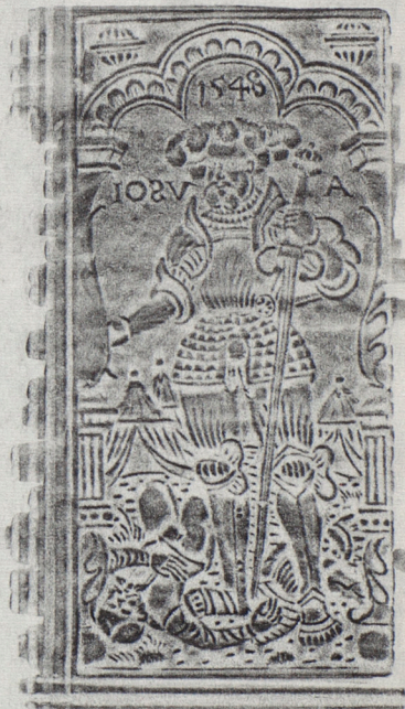
89 x 42

gezeichnet sein, 4 Subtilien a Haupt tri/ist für Kapitel 2 Hüne (1 Löt)