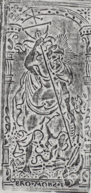
88 x 41