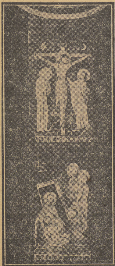
Detalj av mässhaken.

Ateljé Licium visar i sin avdelning på utställningen en hel sorgeskrud — antependium och två mässhakar — som starkt fångar uppmärksamheten. Gruppen, som torde vara ett skänkas till någon kyrka