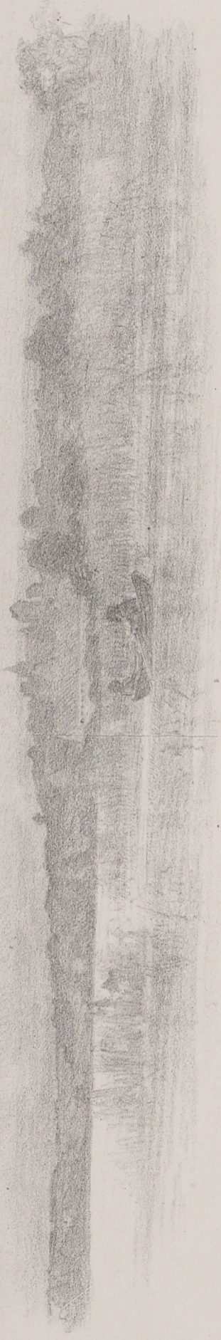
Vy från Siekla.