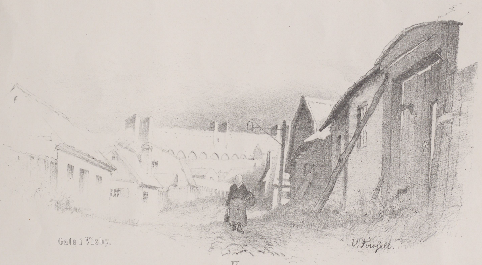
Gata i Visby.