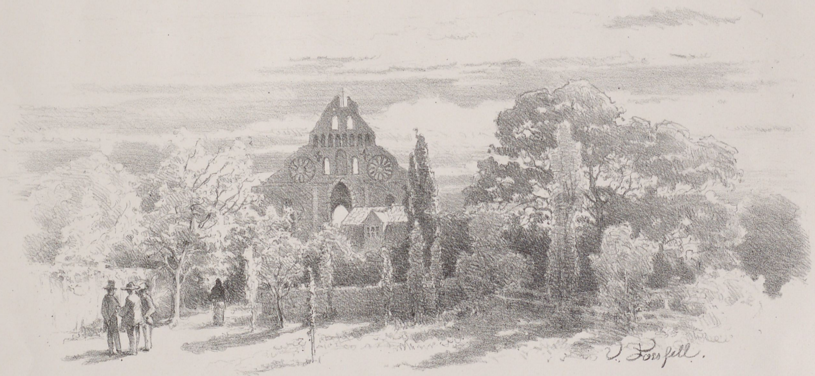
St Nicolai Ruin i Visby.