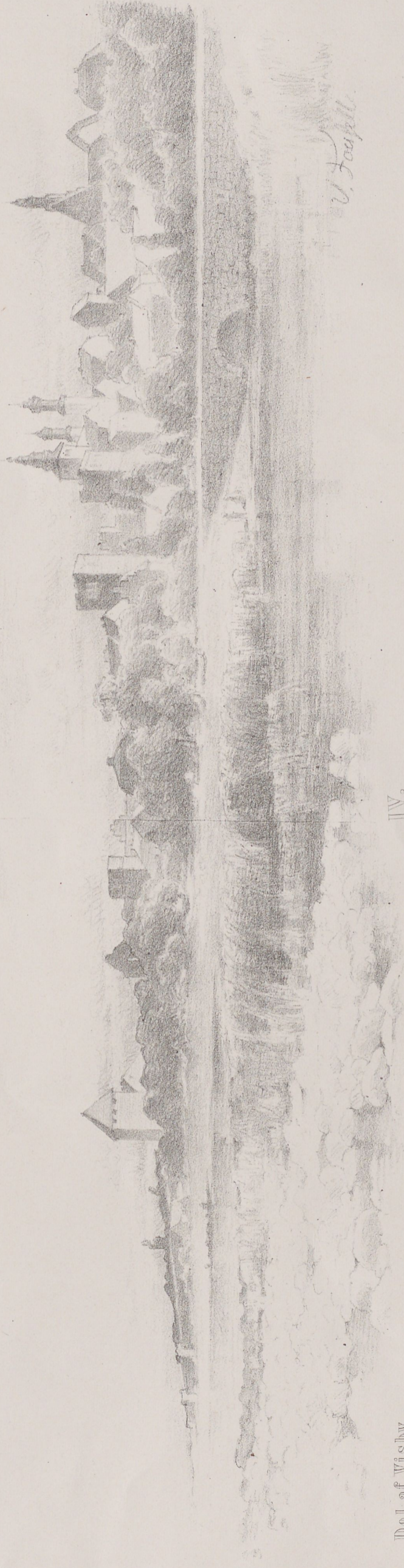
Del af Visby.