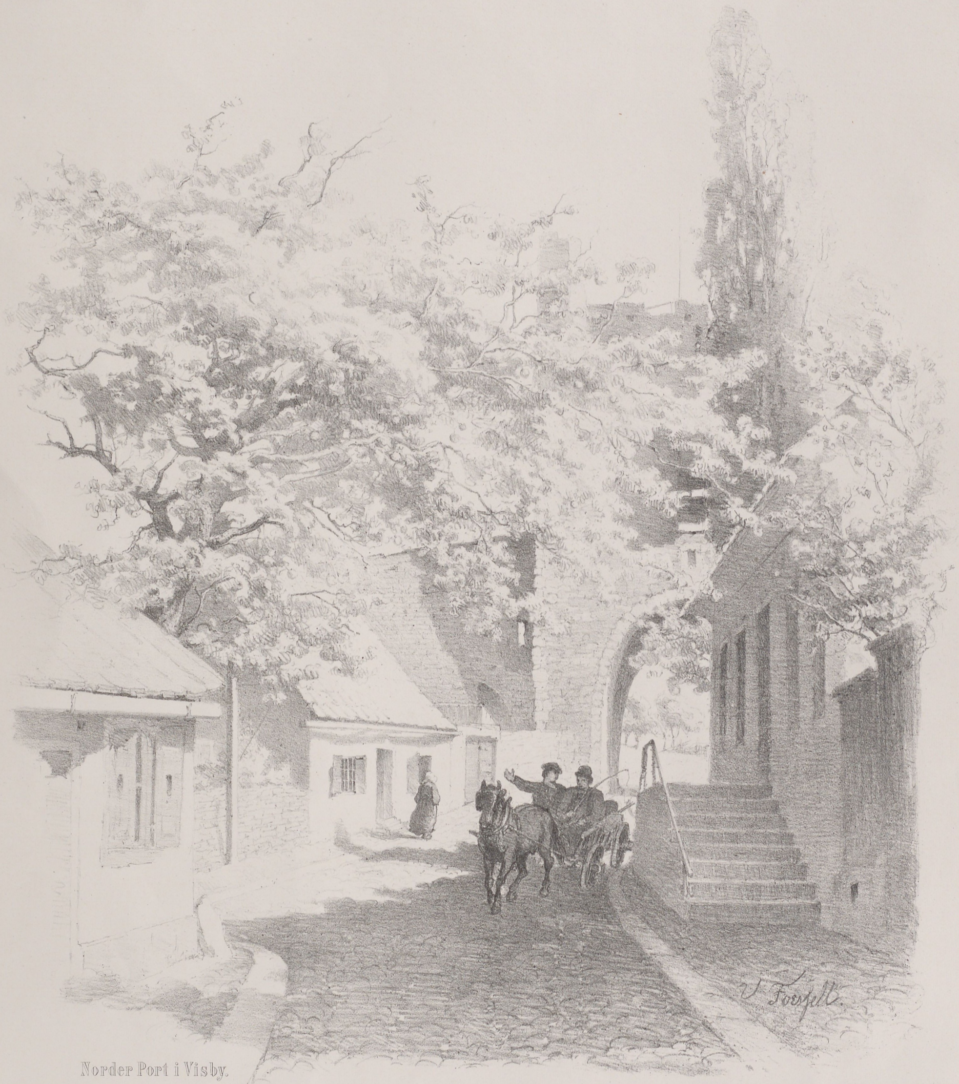
Norder Port i Visby.