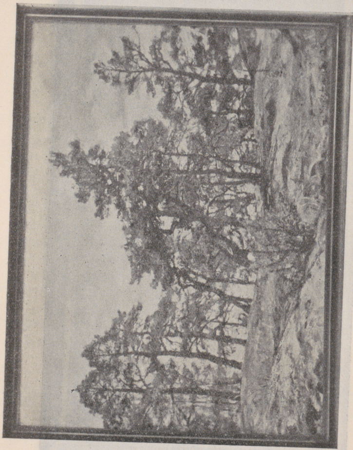
Gottfrid Kallstenius: Martallar vid kusten.