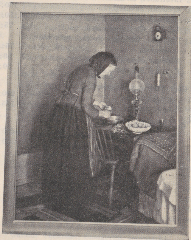
Herman Norrman: Konstnärens mor.