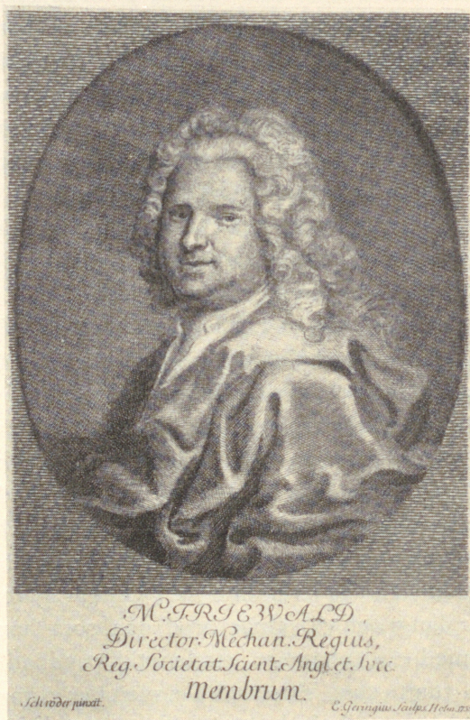
Ur Föreläsningar över nya naturkunnigheten.

✓ holmen samt införa silkesodlingen i Sverige. Detta kröntes med växlande framgång; en sommar, då det rådde stor torka, gick så gott som hela mullbärsodlingen förlorad, därigenom att han försummade att vattna rötterna, som ännu på hösten befunnos vara friska och levande. En annan gång ströko mullbärsträden med på grund av den starka kölden; men sedan han på Linnés uppmaning planterat en sort mullbärsträd, som väl