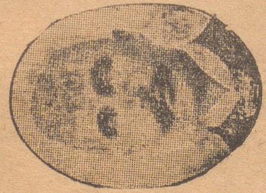
Justitieminister Berndt Hasselrot.

När den förklingat, framträdde aftonens hufvudtalare, justitieministern Hasselrot, hälsad af en hjärtlig välkomstapplåd. Med spänd uppmärksamhet följde åhörarna den sakliga och utredande framställningen, och gång efter annan dånade applåder från församlingen.