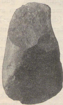
Stenyxa, hittad på Storgården.