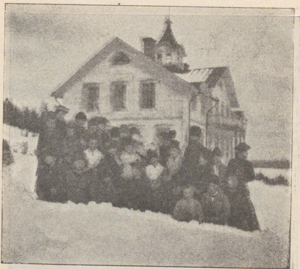
Grupp med barnhemmet i bakgrunden.