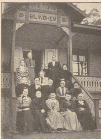
Föreståndarinnan och en del af de blinda kvinnorna på hemmets trappa.

“Och här står nu ålderdomshemmet färdigt, ett skönt vittnesbörd af Herrens outtröttliga frälsarekärlek öfver oss, svaga människobarn. Frid och väl-