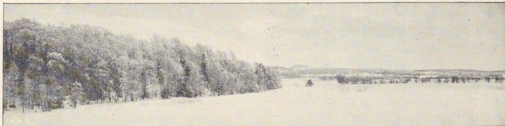
Falköping 1904, Falköpings-Postens tr.