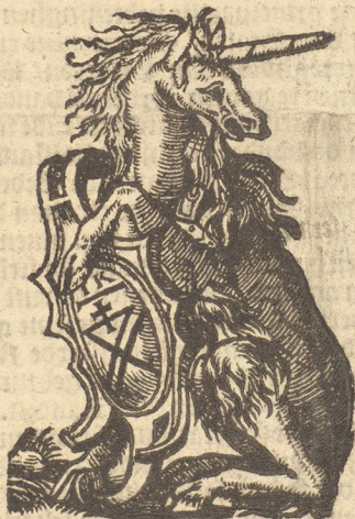
Nae de Coppe tot Mechelen.