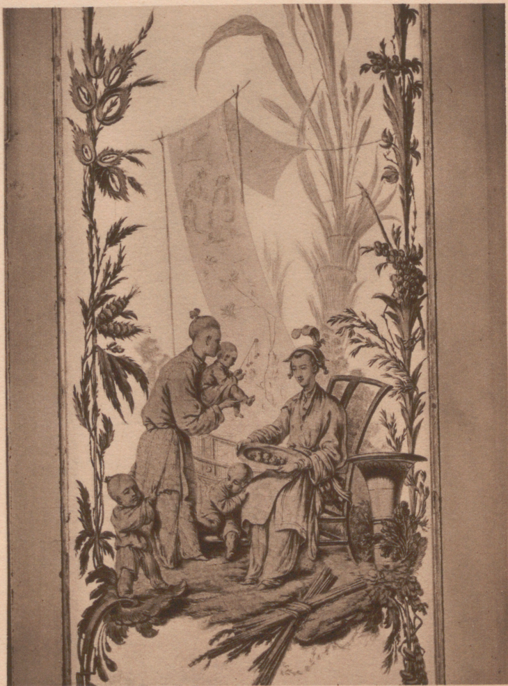
Väggmålning efter komposition av Boucher. Blå salongen.