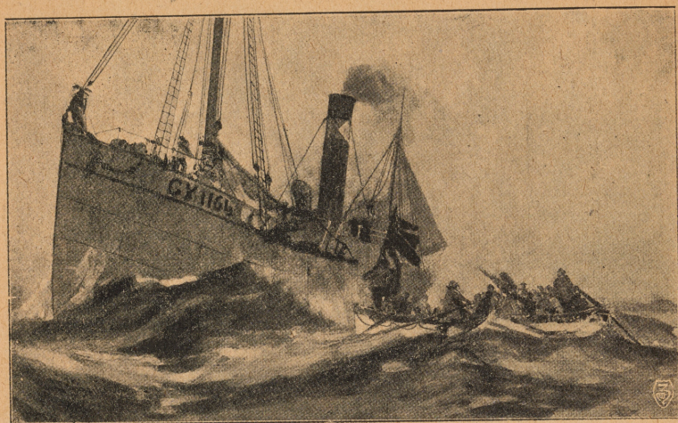
Från »Norges» undergång. Skeppsbrutna räddas ombord på »Salvia».

Det sista öde som vi fått höra, Båd' Sverige, Norge och Danmark röra. Ja månet lyckligt och fridfullt bo, Har sönderrifvets af sorgens klo.