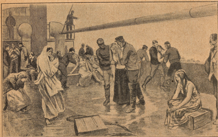
Skeppsbrutne emigranter från »Norge» räddade ombord på »Salvias» däck.

Skarpt flög hans blick genom täta dimman, Då märktes plötsligt i morgontimman En häftig stöt, och till allas skräck Ljöd ropet: "skeppet ha'r sprungit läck".