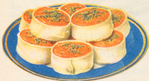
»Aprikosbakelser» Recept å sid. 27.