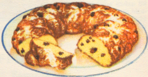
»Födelsedagskrans» Recept å sid. 11.