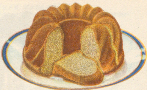
»Mjuk pepparkaka» Recept å sid. 18.