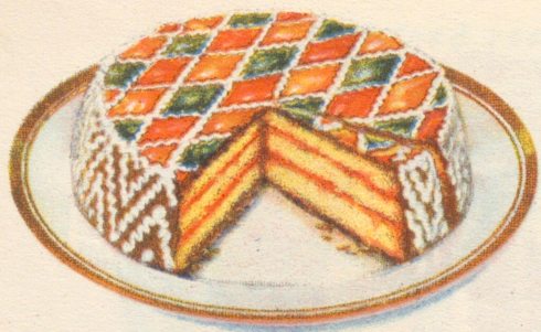
»Tårta à la Skottland» Recept å sid. 23.