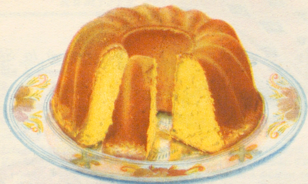
» Sockerkaka » Recept å sid. 14.