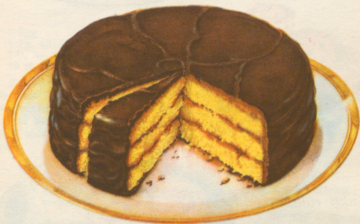
» Chokladtårta » Recept å sid. 25.