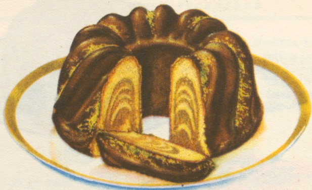
»Marmorerad tékaka» Recept á sid. 15.