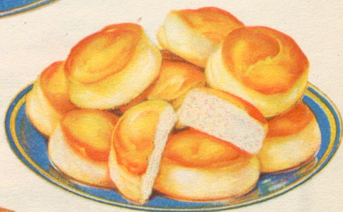
»Frukostbullar» Recept å sid. 4.