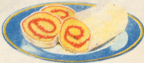
»Enkel rulltårta» Recept å sid. 16.