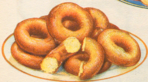
»Munkringar» Recept å sid. 14.