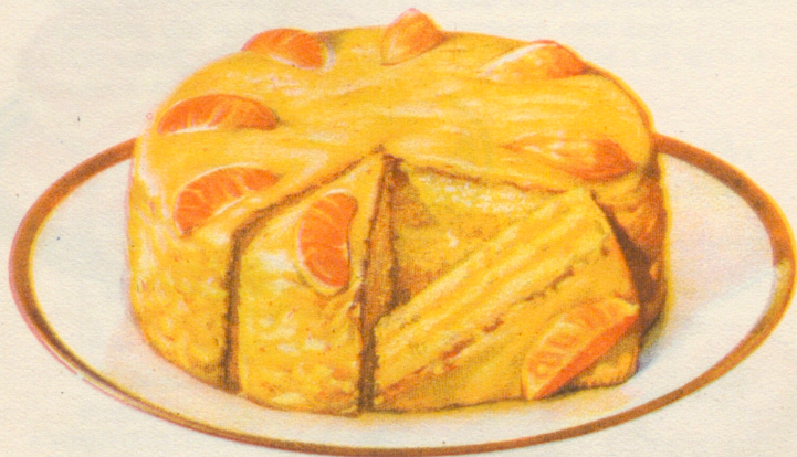
»Apelsintårta» Recept á sid. 25.