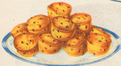
»Korintmuffins» Recept å sid. 13.