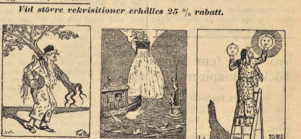
Och Herren Gud planterade. Och himmelens fönster öppnade sig och ett störtregn kom öfver jorden. Och Gud gjorde de två stora ljusen, det större att herska öfver dagen, det mindre att herska öfver natten. 1 Mos. 1: 16.

Vid större rekviritioner erhålles 25 % rabatt.