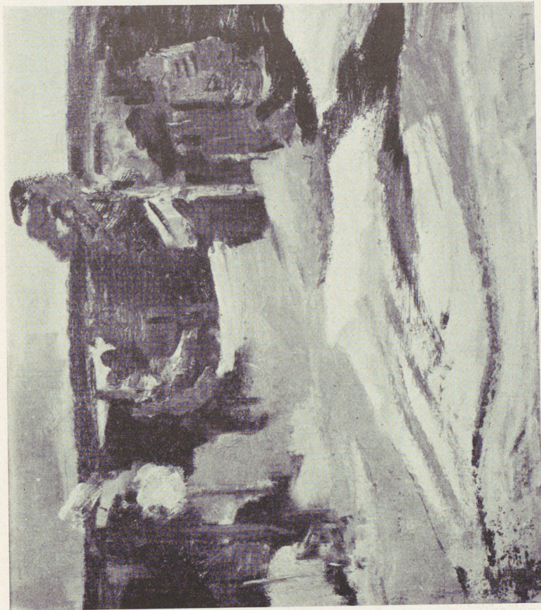
Vinter. Nr 46.