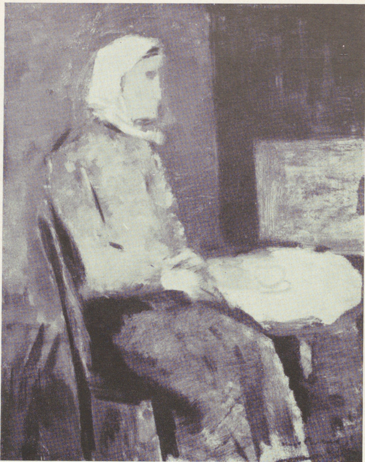
Småländsk torparhustru. Nr 44.