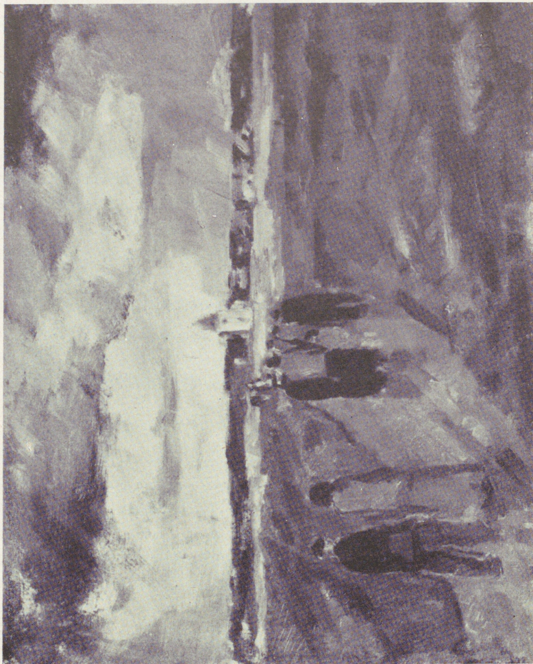
Kyrkfolk. Nr 45.