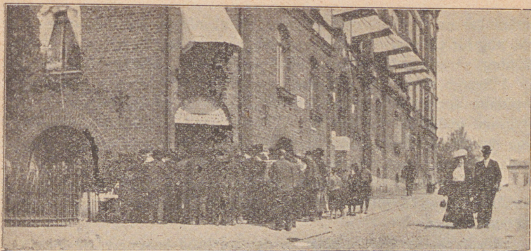
Göteborgssystemet gör affärer.