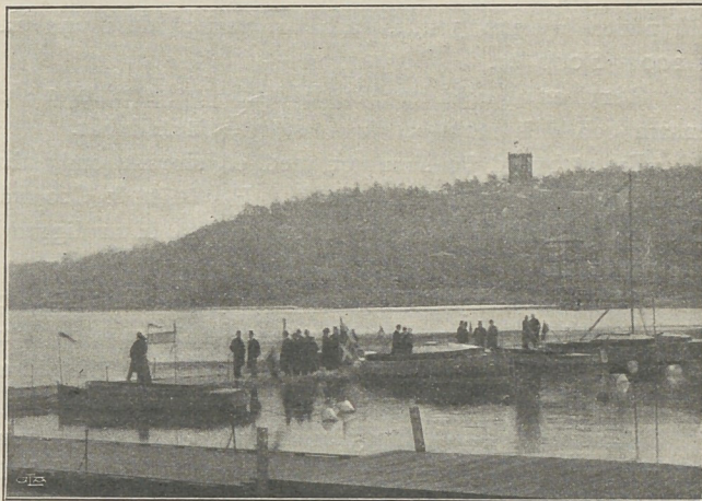
Fig. 3. Utställda motorbåtar.

Motorcyklar med 2\frac{3}{4} å 3 hkr motorer utställa AB. Amerikansk Cycle-Import, Wiklunds Velocipedfabrik samt Bröderna Langborg.