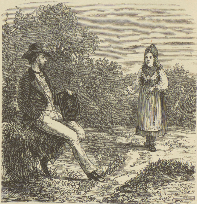
Karl den femtonde och dakullan.