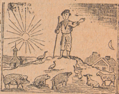
Som vallgosse, 10 år.

En annan tids. tillade: »Sin första vetenskap fick han genom en gammal bondpraktika, som han hittat bland en del sönderrurna böcker på en sophög. Vid äldre dagar var hans största lust att komma till att studera; men ingen bekant hade han som ville hjälpa honom härtill. Det enda han fick af en rik man en gång, vid 17 års ålder, då han bad om hjälp att studera, var — en strut russin, och det var sannerligen ej mycket att taga sig fram i lifvet med — en strut russin. Han försökte allt ifrån den dagen att blifva sin egen uppfostrare och lärare, och genom flitiga studier på egen hand (som handverkare) fick han allt mera och mera kunskap. Vid 20 års ålder slog han sig på författareskapet och gaf sig ut att resa, hvilket han sedan oafbrutet i med- och motgång hållit på med och blifvit ännu väl än illa bemött och varit ute i alla väder, och försökt mycket, genomrest 90 svenska städer och minst 700 byar m. m. Farit ofta illa som en varg. Begynt sin bana med några öre, men genom flit och ett enastående lif tagit sig fram ändå, och till sist byggt sig en liten boning vid Mälaren; ett hem, visserligen ej något att lefva af. Författaren som martyr, då men dock ett hem för kommande dagar, och derhan bjöd ut böcker till en obehörfvadt pris. Han författat »Solsången, Stjernrymden Planetenkant, sin herre på ett konungars m. fl. bekanta stycken. Se der, hvad dentor, en som trodde det var som har vilja kan uträtta!»