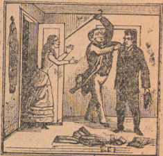
»Otack är verdens lön.»

från Stockholm. Innehåller dessa skrifter är tillräckligt för att ge en liflig bild af författaren som en riktig hjälte.