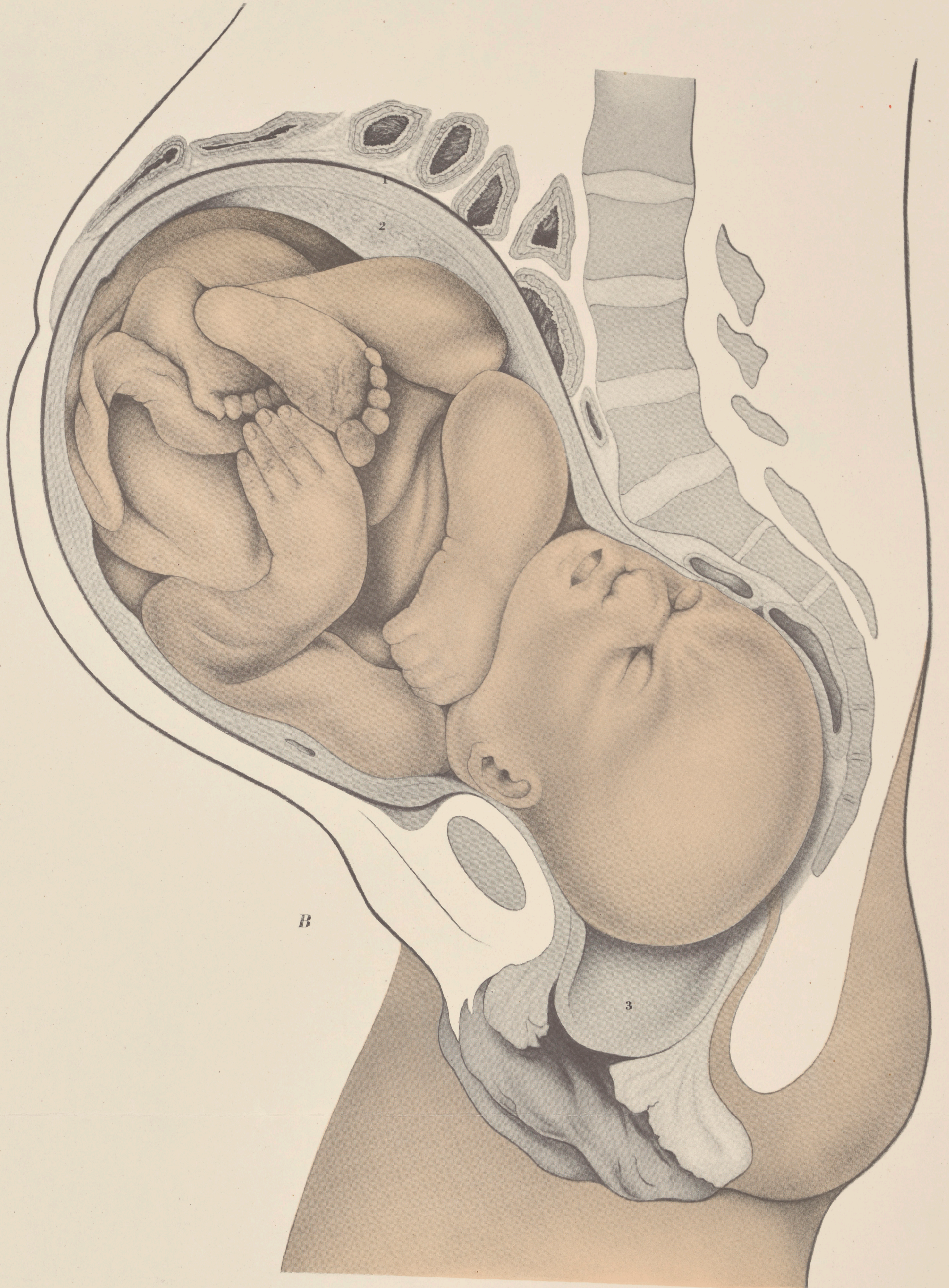
B Nio månader gammalt foster vid förlossningens början