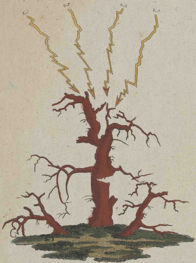
Der Corsische Giffbaum.