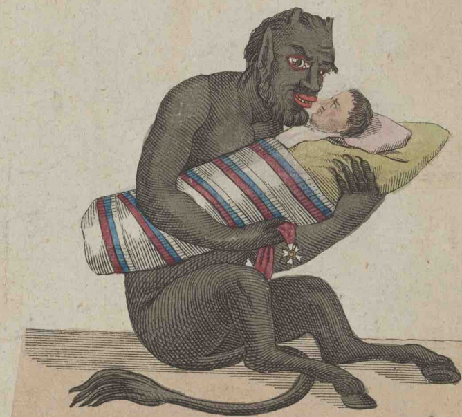
Das ist mein lieber Sohn, an dem ich Wohlgefallen habe.