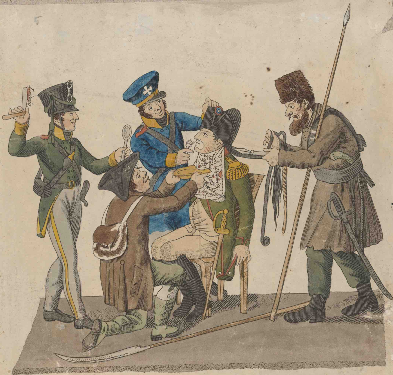
Die Leipziger Barbierstube.