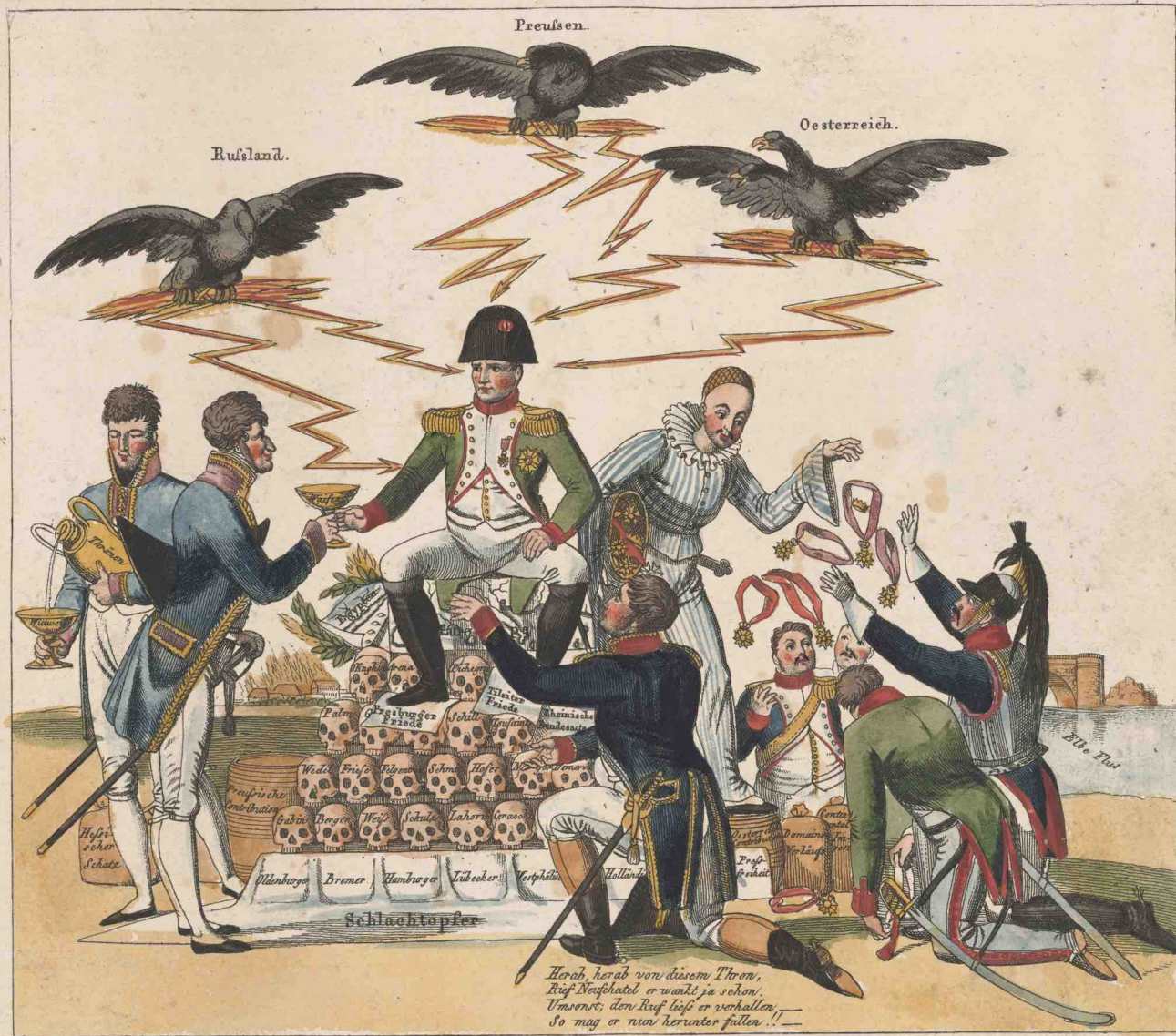
Der neue Universalmonarch auf dem zum Wohl der Menschheit errichteten Throne.