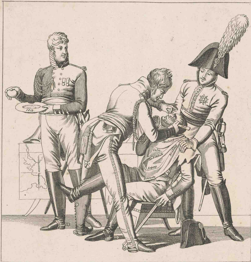
Die neue Europaische Barbierstube. Die neue Europäische B. 8