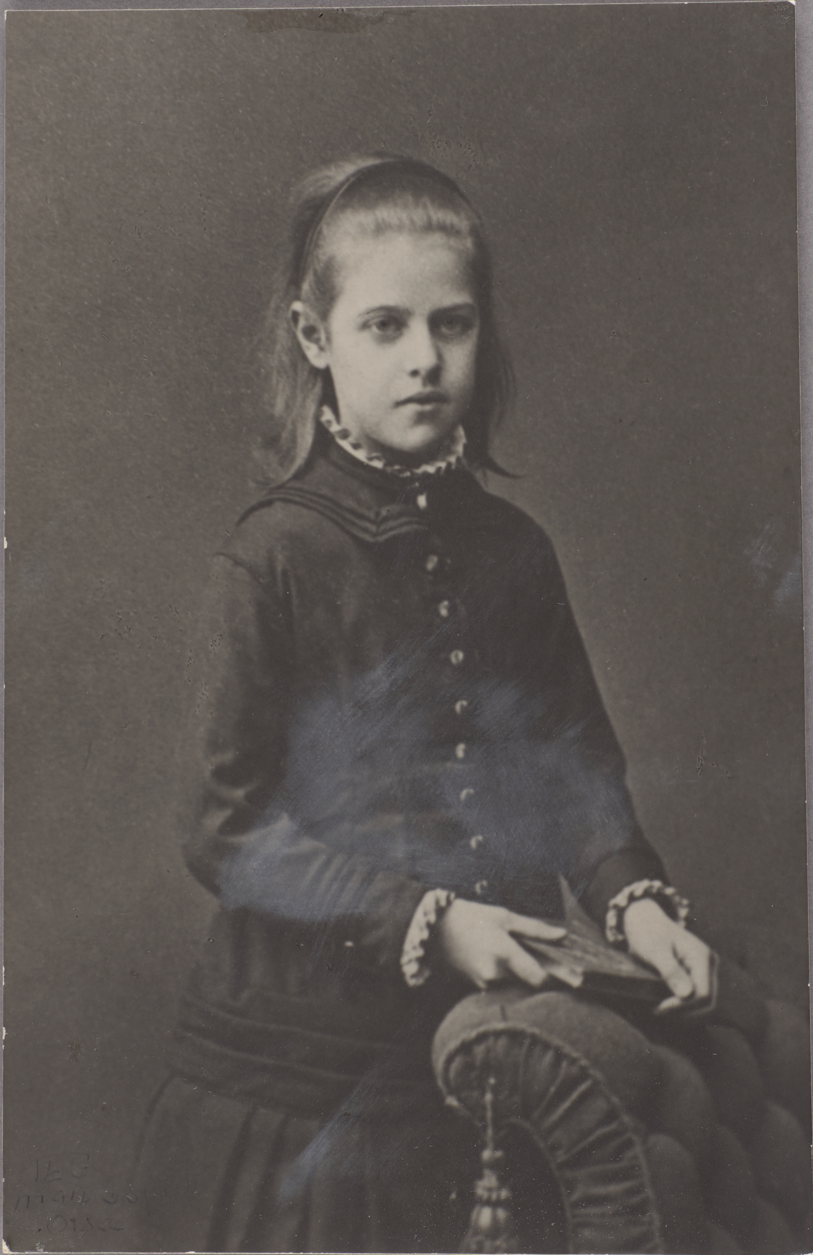
Bild // Elisabeth Beskow i halvbild som tioåring med en bok i handen