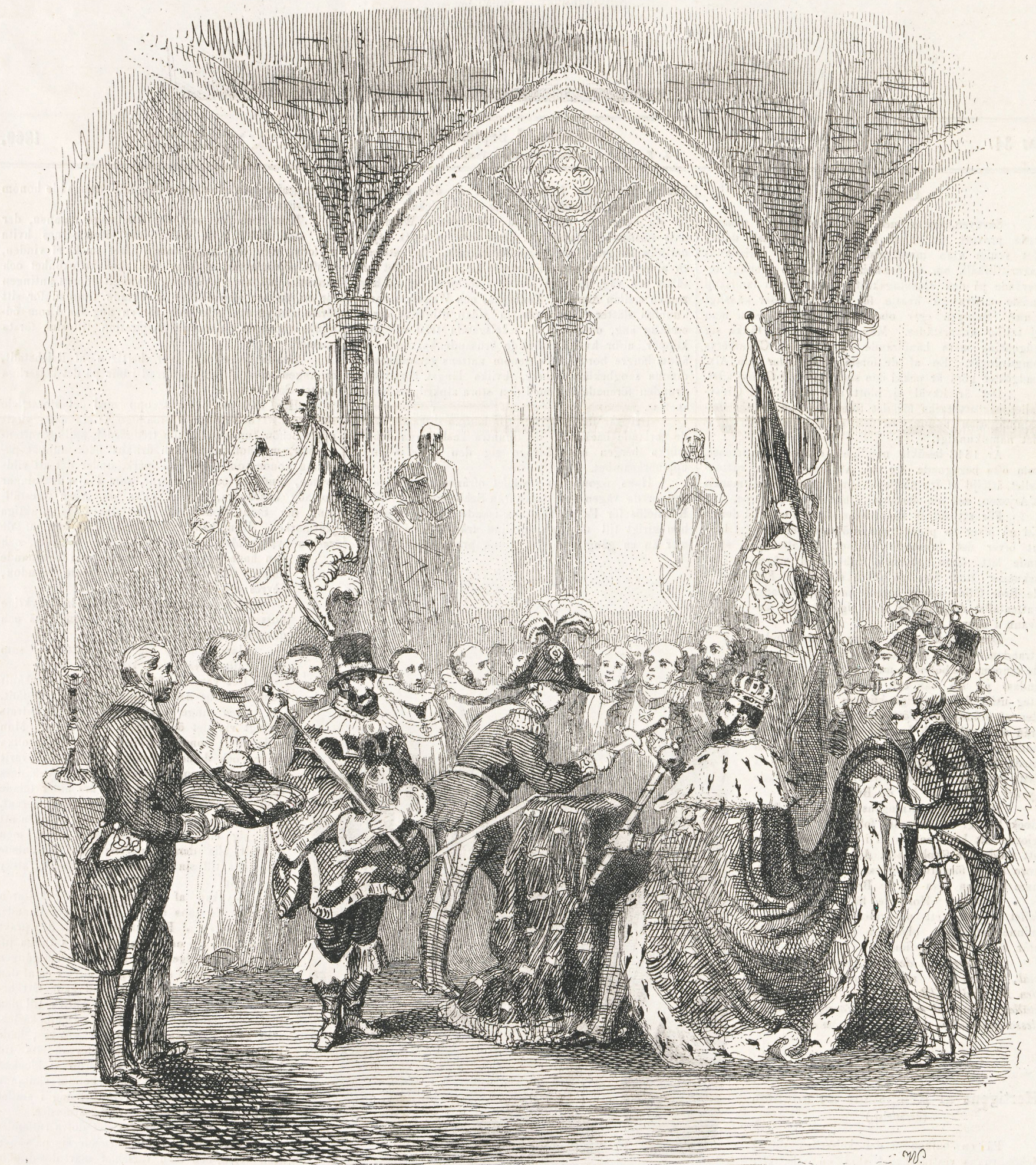
Kröningsceremonien i Thronhjems domkyrka.

»Ack ja, det är ju det enda minne jag eger efter honom... Jag såg honom aldrig mera... Han reste då till det stora fälttåget 1814, i hvilket äran helt och hållet var på den besegrades sida... Du kan ej tro, Fanny, huru vacker han var!... Vacker som krigsguden!»