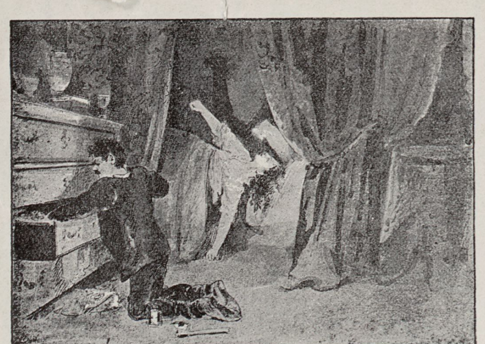
Grupp III. Förbrytelsen.