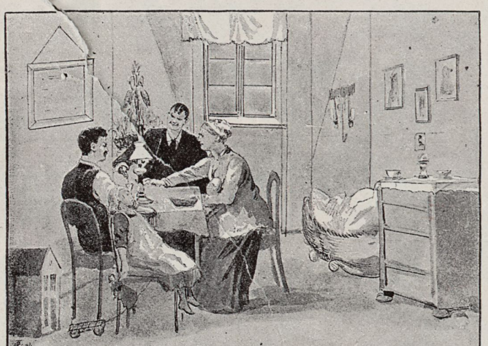
Grupp I. Ett lyckligt hem. Frestaren.