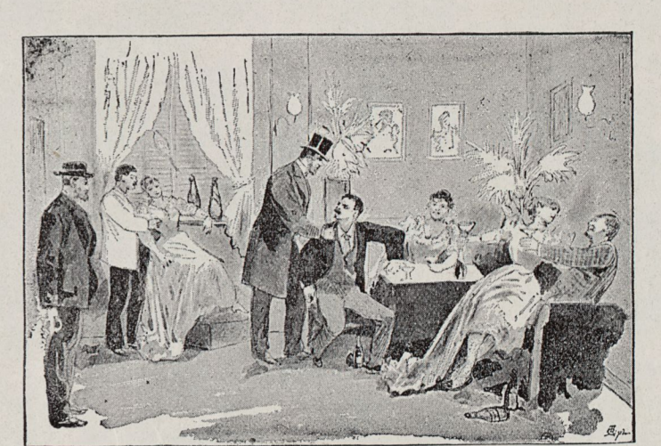
Grupp IV. Arresteringen.

Skildring af ett lif genom frestelse och fall