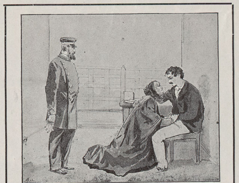
Grupp VI. Afskedet i fängelset.